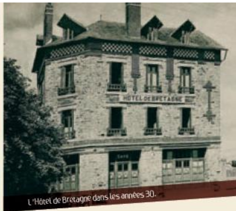
L'Hôtel de Bretagne dans les années 30.

Quatre générations se sont succédé à l'Hôtel de Bretagne