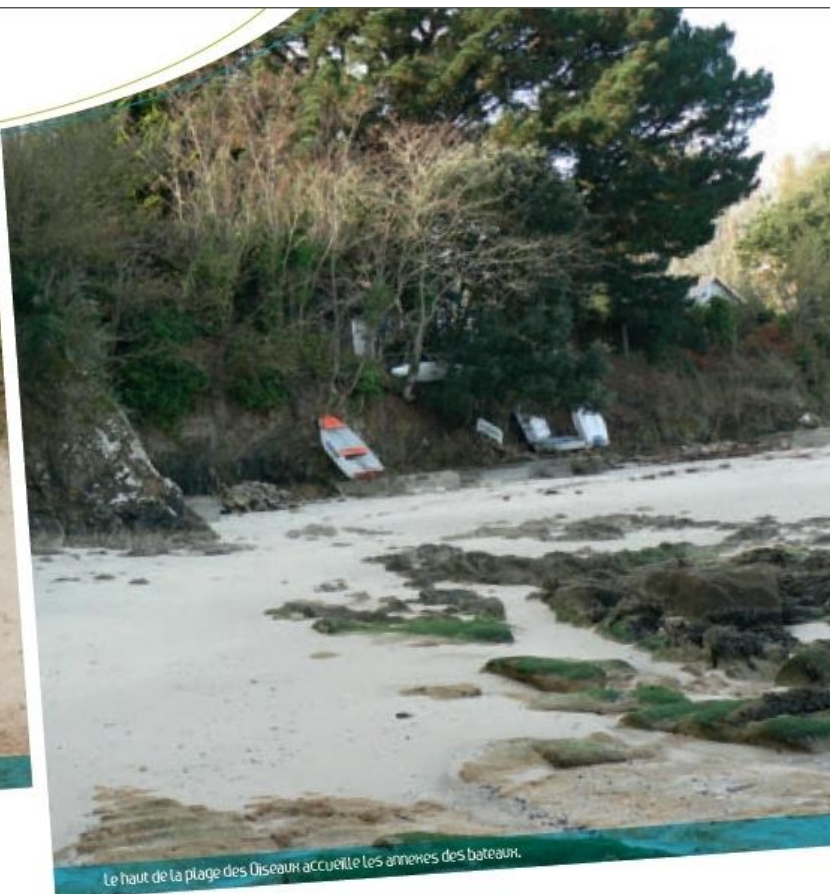
Le haut de la plage des Dizeaux accueille les annexes des bateaux.

Une issue a enfin été trouvée dans le dossier complexe du sentier côtier de Beg-Meil