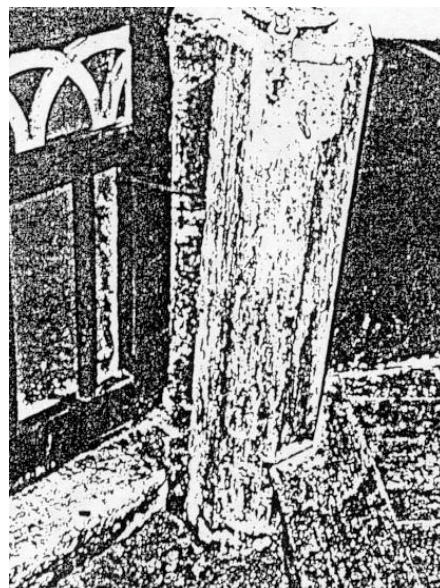
Tronc en bois de 1844