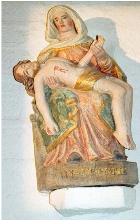
Statue en bois polychrome PIÉTA

Dès l'accident, le général de la paroisse se réunit et décida de prélever 300 livres dans la cassette de la chapelle de Kerbader " pour être employées à faire un sanctuaire en l'église de Fouesnant." Ceci montre que les revenus de la chapelle de Kerbader n'étaient pas négligeables, mais également, ce lourd prélèvement n'a-t-il pas retardé de quelques années les travaux de reconstruction ?