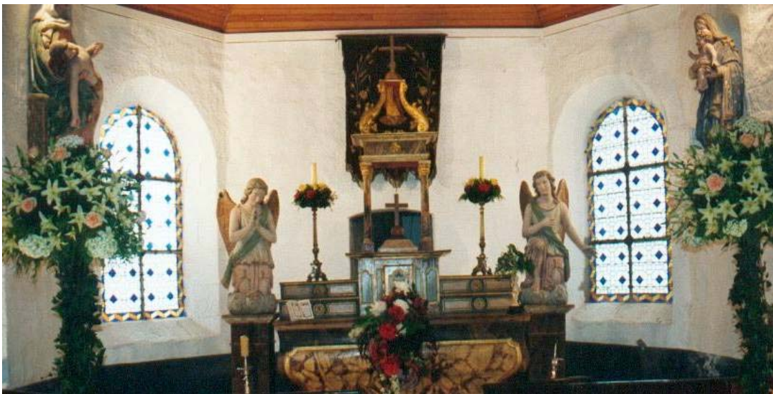
L'autel encadré par deux anges adoreurs est en bois et date de 1853

Elle est connue sous le nom de chapelle de Notre dame des Neiges et le guide explique cette appellation étonnante pour notre région par le fait qu'il neigea autrefois un 15 mai, jour du pardon.